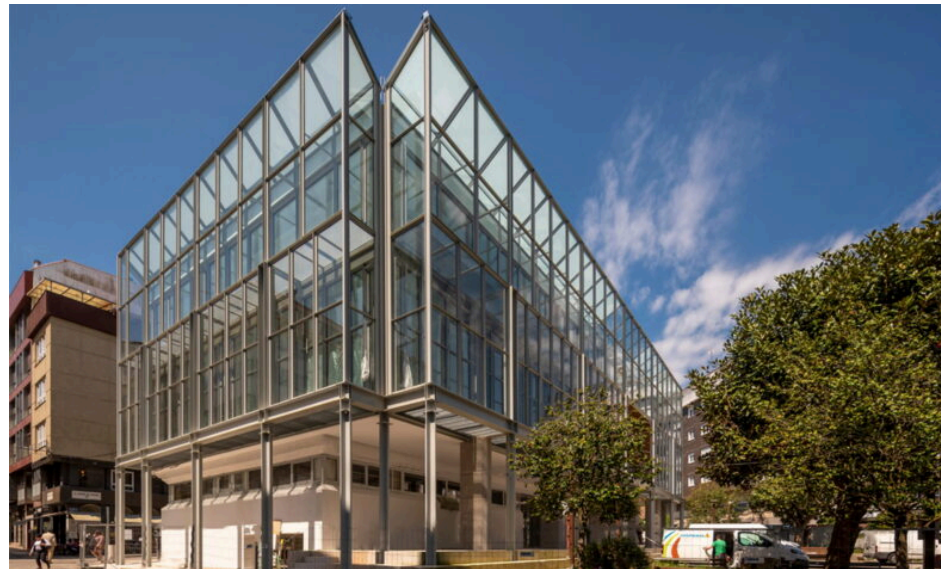
Premio ATEG 2025 Reabilitação Energética da Câmara Municipal da Ribeira, Corunha, do arquitecto Carlos Seoane